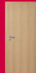
Stejar Ușă Ringodor

Suprafețe reproduse din rășini sintetice, care imită perfect lemnul și sunt rezistente la abraziune, lumină, agenți chimici, căldură, și agenți de curățare