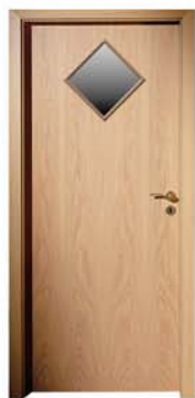
K 301 M1