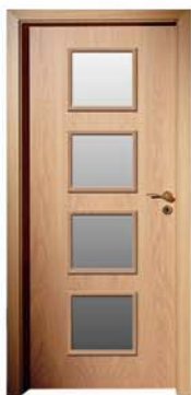
Q 301 M4