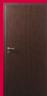
Wenge Ușă Ringolit