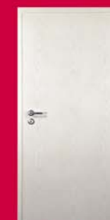
Frasin alb Ușă Ringodor