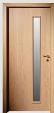
E 149 S1