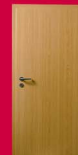
Fag Ușă Ringodor