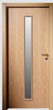
E 149 M1

NOU Pentru mai multă culoare în decupaje, consultați programul Filyran de folie decorativă.