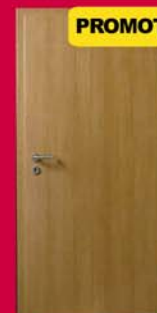
Cireș Ușă Ringolit