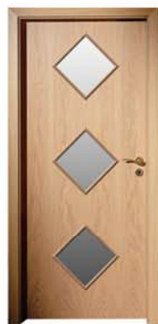
K 301 M3